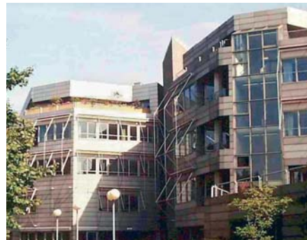
Gebäude der Fachakademie für Augenoptik München (FFA)

Das Studium schließt mit dem akademischen Grad Bachelor of Science (B.Sc.) ab.