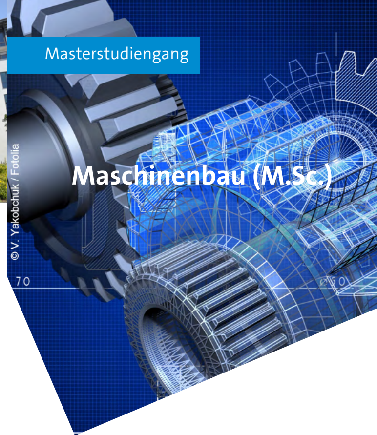
Stand: 03/2017