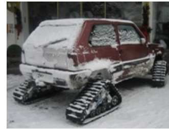
ATV, Quad, Umbau